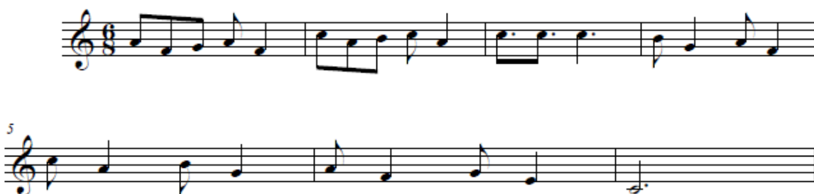
Figura 4. Cadencia del primer tema de “Takamba”

La presentación de esta primera sección contiene su resolución, a manera de cadencia, para regresar a un primer grado mayor (véase figura 4 ).