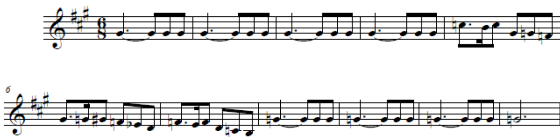
Figura 6. Reexposición de “Takamba”