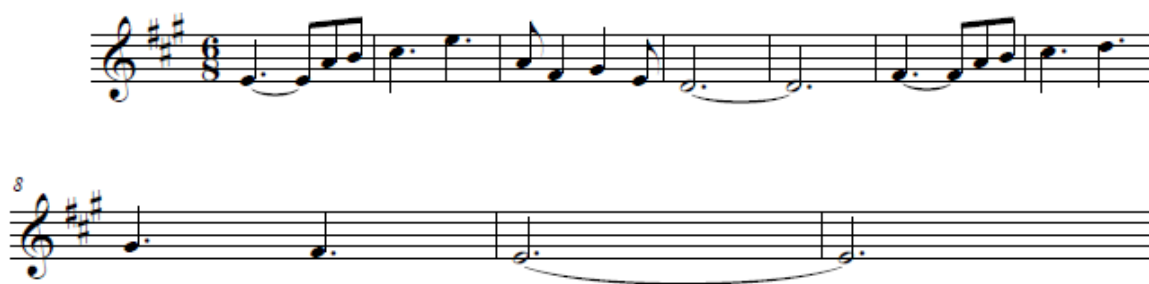
Figura 5. Preparación para el segundo tema de “Takamba”

Un giro armónico, hacia el quinto grado del homónimo mayor del relativo menor de la tonalidad original (véase figura 5), deja el terreno listo para presentar el segundo tema, con un tempi más lento: